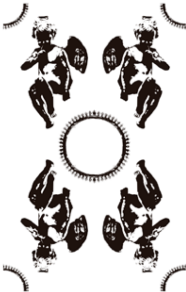
Patrón de repetición

La serigrafía, la impresión con matrices digitales de relieve, la transferencia térmica y la preparación de archivos para la producción de superficies en continuo serán los procesos sobre los que se trabajará.