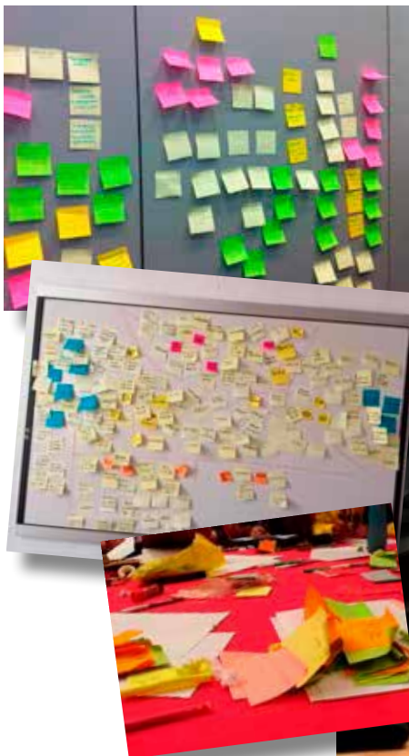
Procesos de trabajo con diferentes dinámicas de grupo y estrategias de creatividad