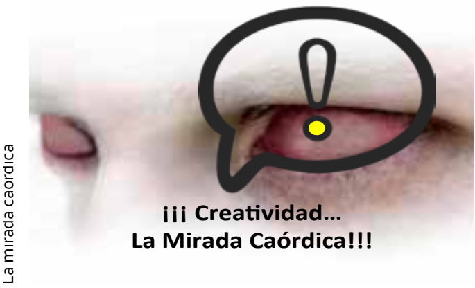
La mirada caórdica

Creatividad Aplicada: El desarrollo de los contenidos se orienta hacia la aplicación práctica de los recursos, por tanto se realizarán sesiones de creatividad que diseñaremos a modo de taller; para desarrollar habilidades y capacidades orientadas al desempeño profesional de alto nivel.