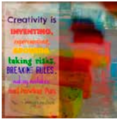
Diferentes aspectos de la creatividad