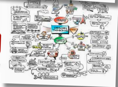
Algunas técnicas de creatividad... Brainstorming de A. Osborn, Seis sombreros para pensar de E. de Bono, mapas mentales de Toni Buzan; y los 5 pasos del Design Thinking