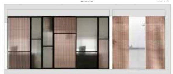
Estado reformado_cocina / recepción